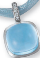
K10252 Brill. 0,03ct H/Si Topas beh. € 399,-