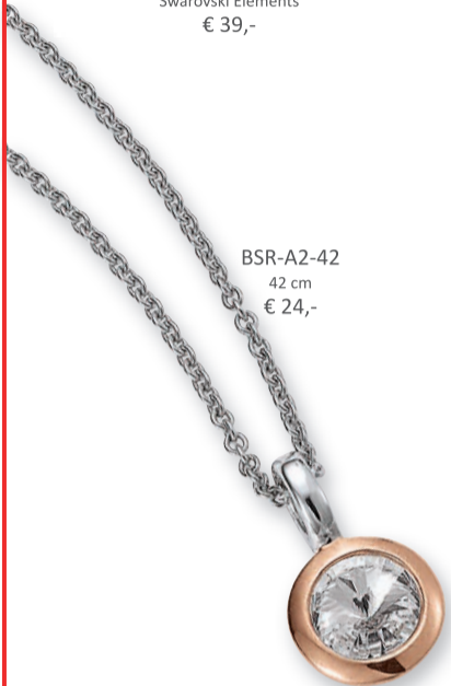
BSR-A2-42 42 cm € 24,-