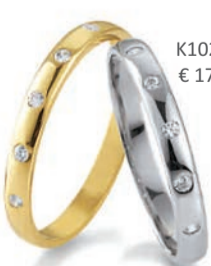
K10272/G € 179,-