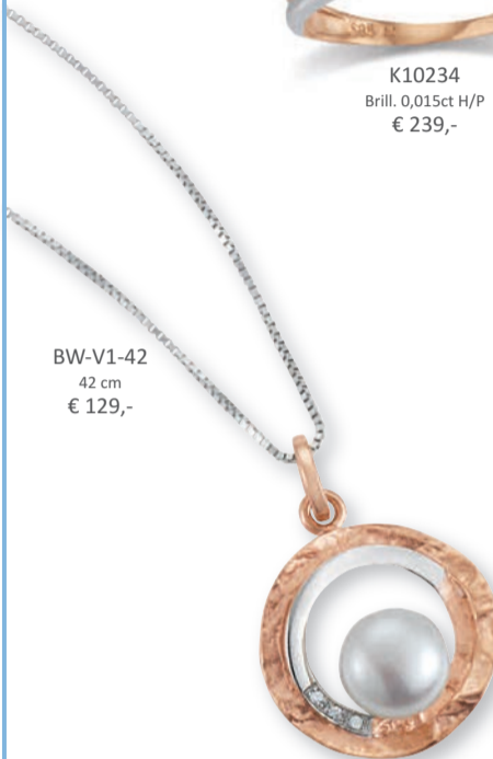
BW-V1-42 42 cm € 129,-