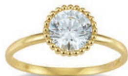
K10270 € 189,-