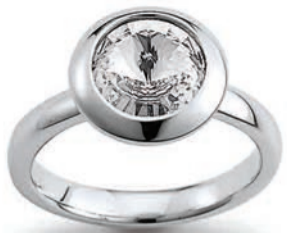
K10258 Swarovski Elements € 79,-