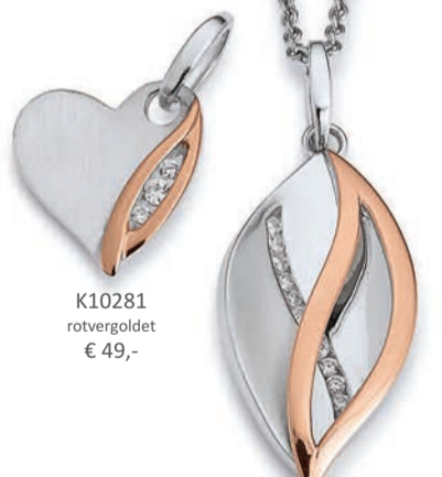
K10281 rotvergoldet € 49,-