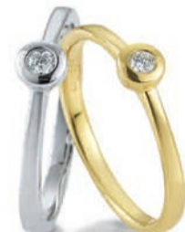
K10243/G Brill. 0,05ct H/Si € 239,-