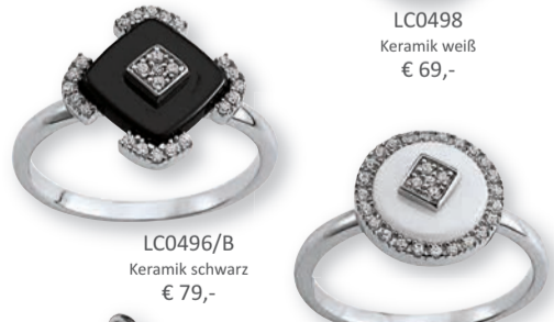
LC0496/B Keramik schwarz € 79,-