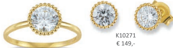
K10271 € 149,-