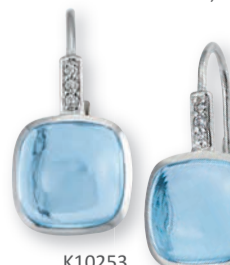
K10253 Brill. 0,03ct H/Si Topas beh. € 669,-