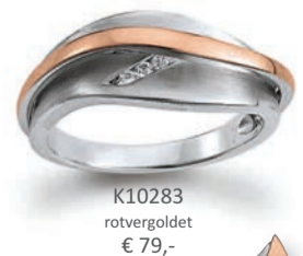
K10283 rotvergoldet € 79,-