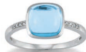
K10254 Brill. 0,04ct H/Si Topas beh. € 489,-