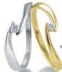
K10246 Brill. 0,07ct H/Si € 269,-