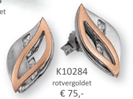
K10284 rotvergoldet € 75,-