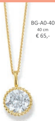
BG-A0-40 40 cm € 65,-