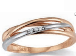
K10233 Brill. 0,015ct H/P € 169,-