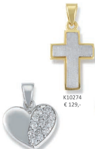
K10274 € 129,-