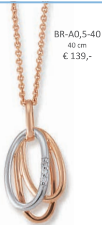
BR-A0,5-40 40 cm € 139,-