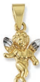
K10277 € 99,-