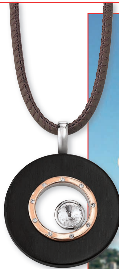
K10266 rotvergoldet · Swarovski Elements Ebenholz · Lederkette 42 cm € 135,-