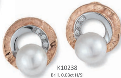
K10238 Brill. 0,03ct H/Si Süßwasserperle € 399,-