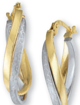
K10267 € 199,-