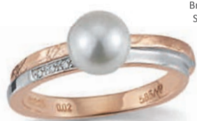
K10236 Brill. 0,015ct H/Si Süßwasserperle € 319,-