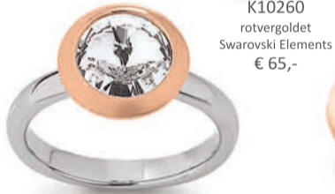
K10260 rotvergoldet Swarovski Elements € 65,-