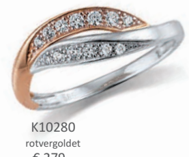
K10280 rotvergoldet € 279,-