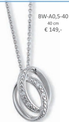
BW-A0,5-40 40 cm € 149,-