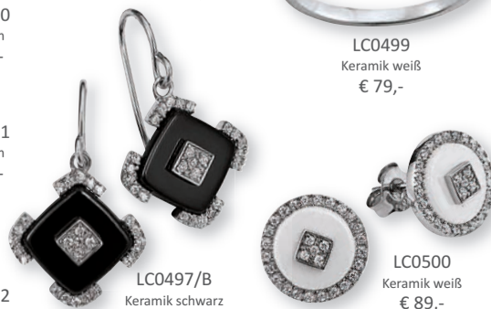
LC0497/B Keramik schwarz € 99,-