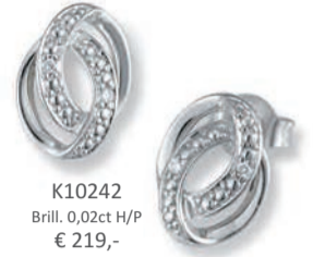
K10242 Brill. 0,02ct H/P € 219,-