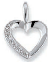
K10239 Brill. 0,01ct H/P € 139,-