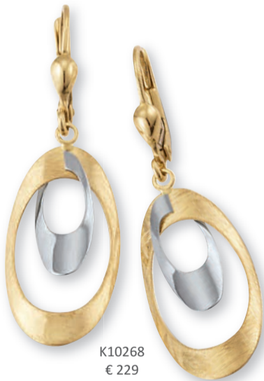
K10268 € 229