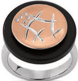
K10264 rotvergoldet · Zirkonie Ebenholz € 159,-