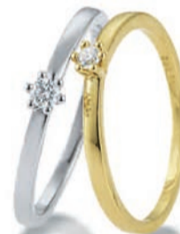
K10244 Brill. 0,07ct H/Si € 299,-