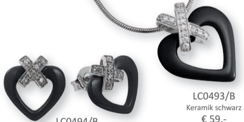
LC0494/B Keramik schwarz € 79,-