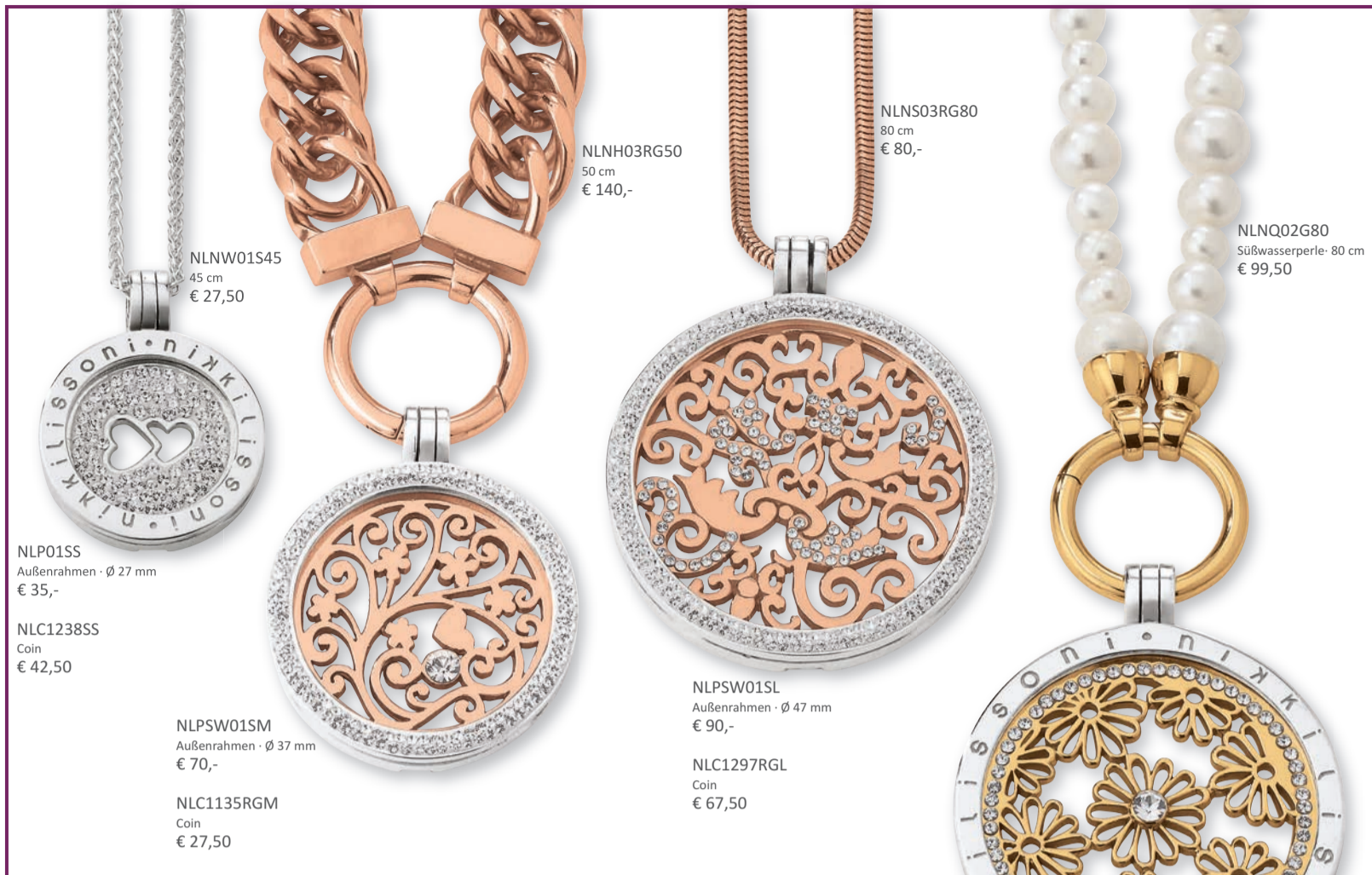
NLNH03RG50 50 cm € 140,-