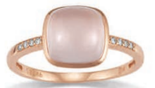
K10256 Brill. 0,04ct H/Si Rosenquarz € 429,-