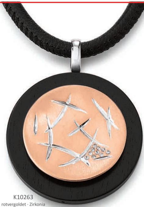
K10263 rotvergoldet · Zirkonie Ebenholz · Lederkette 42 cm € 195,-