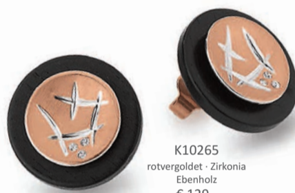
K10265 rotvergoldet · Zirkonie Ebenholz € 129,-