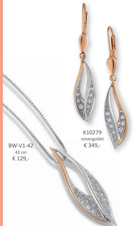
K10279 rotvergoldet € 349,-