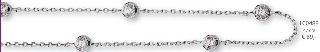
LC0489 47 cm € 89,-