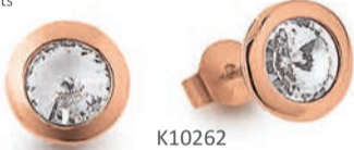
K10262 rotvergoldet Swarovski Elements € 65,-