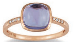
K10255 Brill. 0,04ct H/Si Amethyst € 469,-