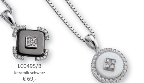
LC0495/B Keramik schwarz € 69,-