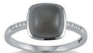
K10257 Brill. 0,04ct H/Si Mondstein € 439,-

Titelseite in Gold 585 K10230 Anhänger · Brill. 0,05ct H/Si · € 399,- BG-A1-42 Kette · 42 cm · € 199,- K10231 Ring · Brill. 0,06ct H/Si · € 539,- K10232 Ohrstecker · Brill. 0,05ct H/Si · € 449,-