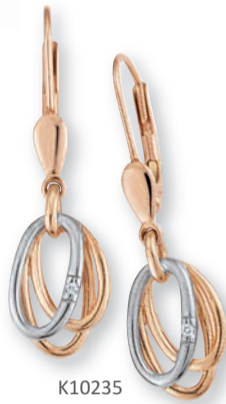
K10235 Brill. 0,01ct H/P € 249,-