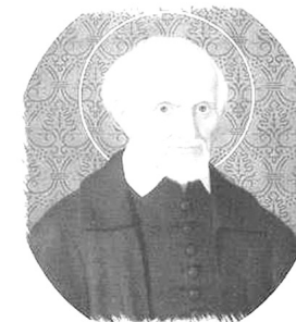
Hl. Vinzenz von Paul

Wir arbeiten mit anderen Vereinen und Behörden zusammen.